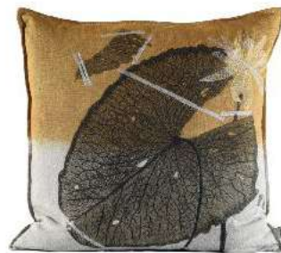
MOIPI EMBROIDERY OCRE 65 x 65 cm