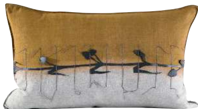
RUBBER APPLIQUE OCRE 70 x 50 cm