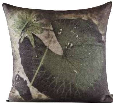
MOPIPI GREEN 50 x 50cm, 65 x 65cm, 75 x 75cm