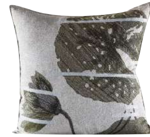
GOBEGAU EMBROIDERY 65 x 65 cm