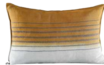
EMBROIDERED STRIPE OCRE 70 x 50 cm