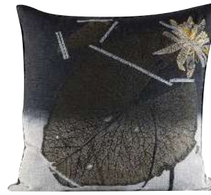
MOIPI EMBROIDERY CHARCOAL 65 x 65 cm