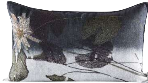
LUMI EMBROIDERY 70 x 50 cm