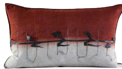
RUBBER APPLIQUE RUST 70 x 50 cm