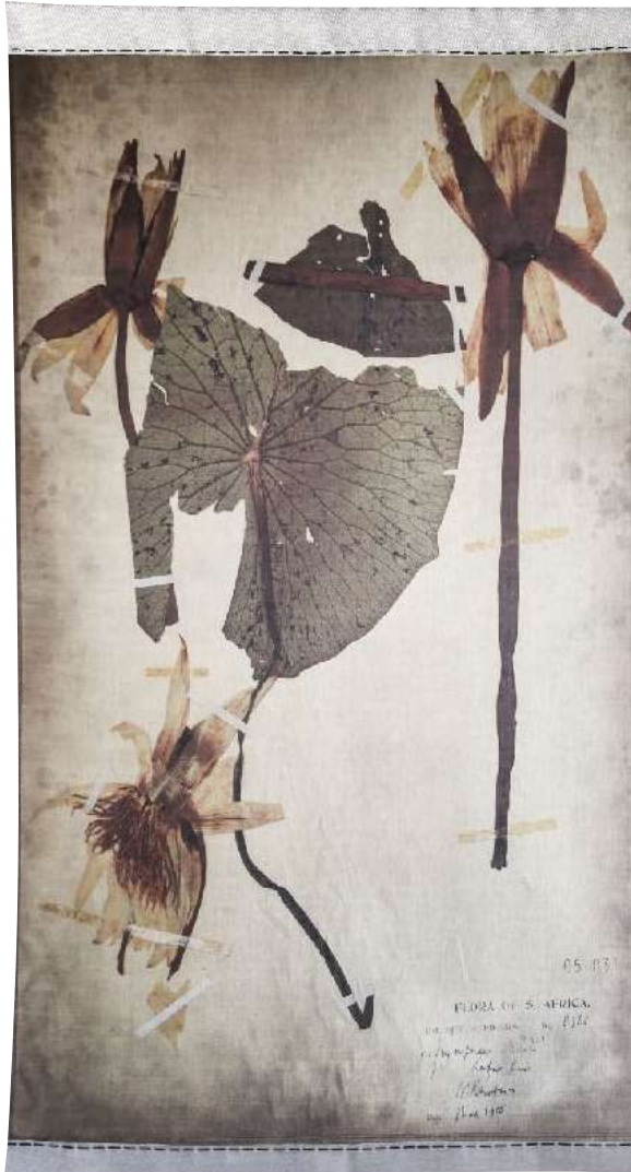
KAFUE PANEL 220cm x 150cm