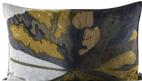
SAMBANDOU EMBROIDERY 70 x 50 cm