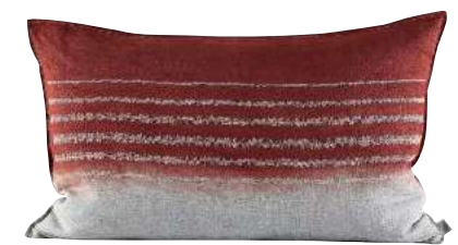
EMBROIDERED STRIPE RUST 70 x 50 cm