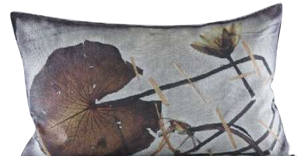
THAMALAKANE PLUM 65 x 45 cm, 70 x 50 cm, 95 x 65 cm