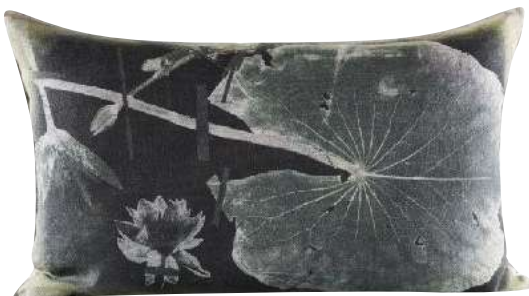
THAMALAKANE GREEN 65 x 45 cm, 70 x 50 cm, 95 x 65 cm