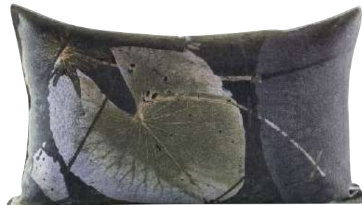
MOPIPI LILAC 65 x 45 cm, 70 x 50 cm, 95 x 65 cm