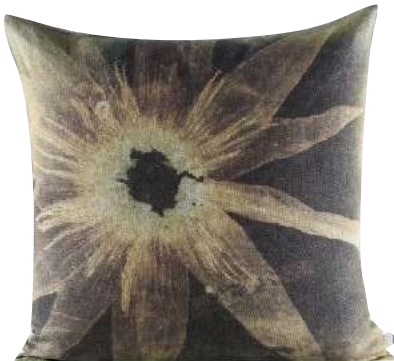
GRAVELOTTE 50 x 50cm, 65 x 65cm, 75 x 75cm