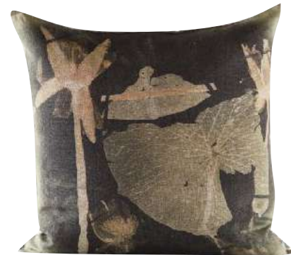
KAFUE 50 x 50cm, 65 x 65cm, 75 x 75cm