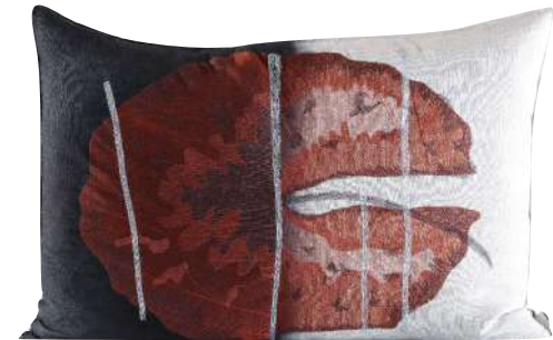
OKAVANGO EMBROIDERY 95 x 65 cm