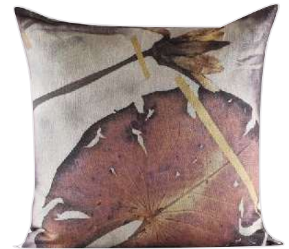
THAMALAKANE RUST 50 x 50cm, 65 x 65cm, 75 x 75cm